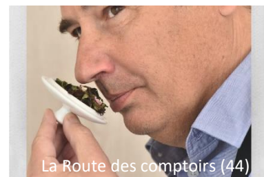
La Route des comptoirs (44)